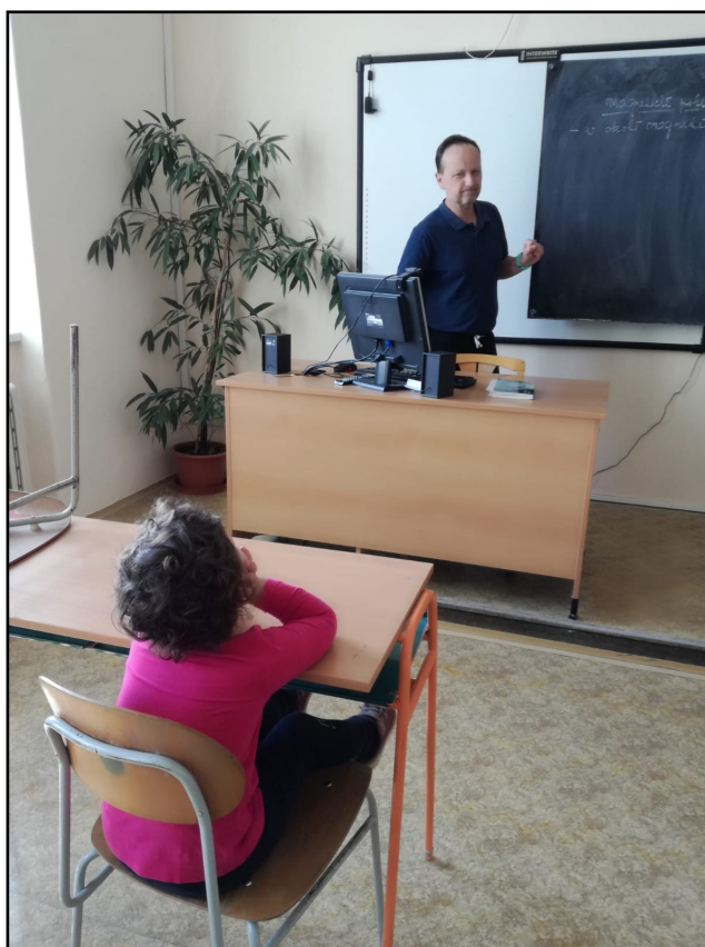
Rodinná hospitace během online hodiny

Velkou nevýhodou byla sociální izolace a omezení kontaktů. My učitelé jsme občas měli pocit, že mlu-