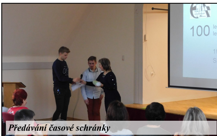
Předávání časové schránky