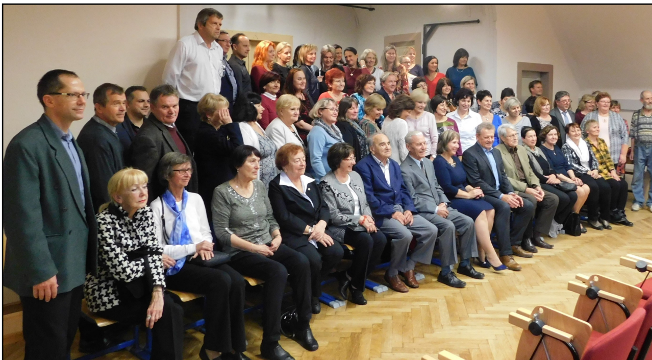
Setkání stávajících i bývalých zaměstnanců školy

Ve školním roce 2019/2020 jsme si připomenuli 100. výročí vzniku břeclavské obchodní akademie. Při příležitosti tohoto jubilea naše škola uskutečnila několik akcí a také vydala almanach.