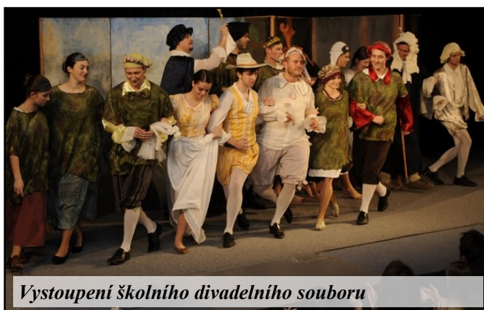
Vystoupení školního divadelního souboru