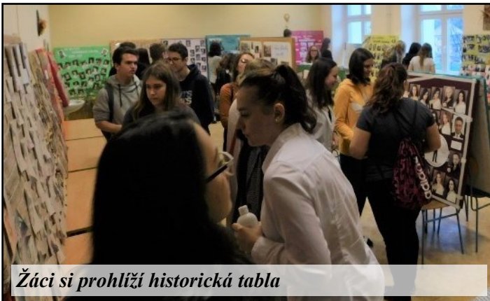
Žáci si prohlíží historická tabla